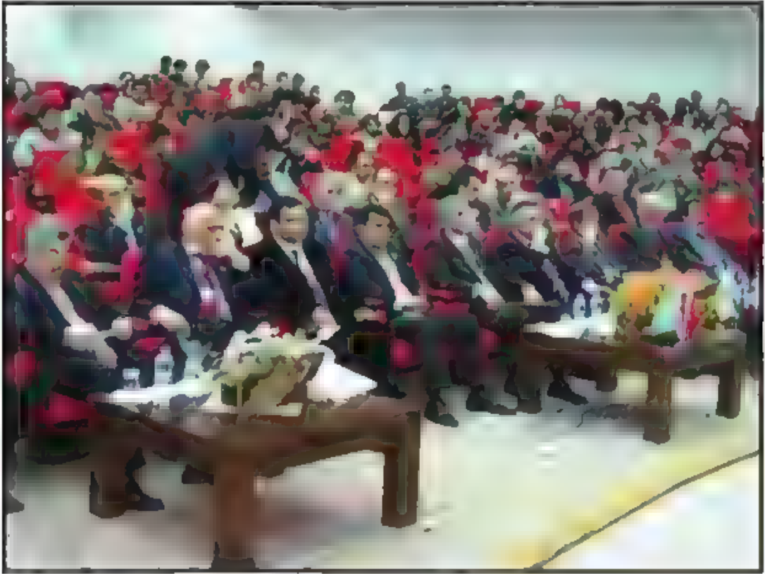
Kars Kafkas Üniversitesi Konferans Salonu